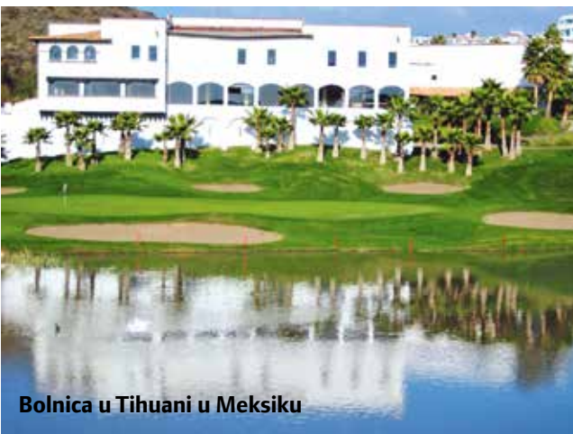
Bolnica u Tihuani u Meksiku

uzroka svojih problema, koji su – u to sam uvjeren – ne u suncu, nego u mojim uvjerenjima o sebi, drugima i svijetu oko mene, a to znači i u odnosima, neriješenim obiteljskim obrascima i slično. Sustavno sam prodirao u dubine svog uma i odbacivao sve što me trovalo. Srećom, većina je zapisana u knjizi "Zdravlje je u nama", tako da se može precizno pratiti kronologiju postupaka. Osim toga, svakodnevno sam izvodio protokol Gersonove terapije, prehranu i detoksikaciju tijela.